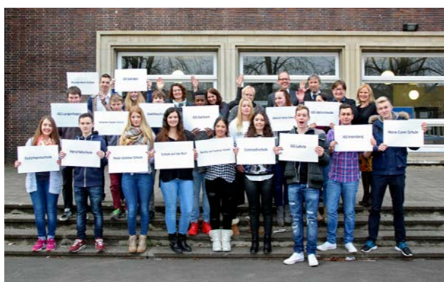
Projektstart 10-2014, Bertha-von-Suttner-Schule