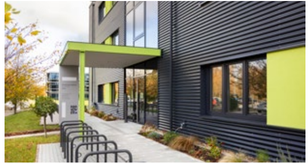
SCIENCE AREA 30X

Jedes fünfte Unternehmen in Deutschland wird inzwischen von einer Frau gegründet. Das Unternehmerinnen-Zentrum Hannover bietet Beratung, Büroräume und ein starkes Netzwerk für Frauen.